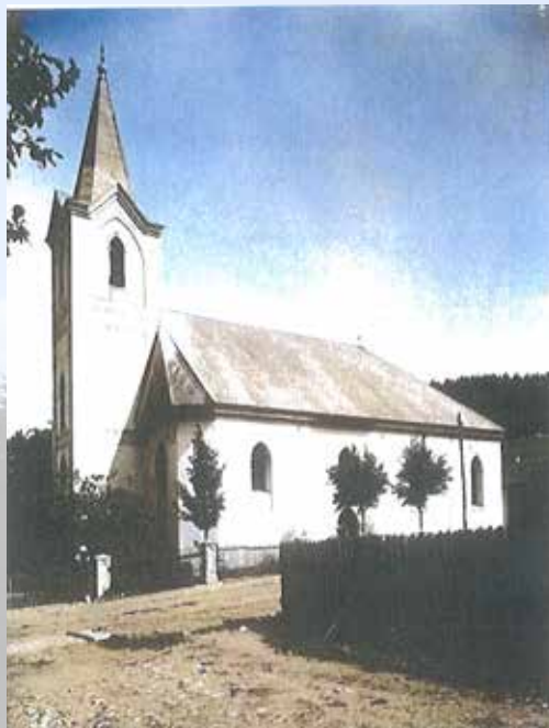
Evanjelický a. v. kostol v L. Jáne na kolorovanom zábere z prvej tretiny 20. storočia

v mestských protokoloch Ružomberka je záznam, že počas epidémie sa v meste na nákup dezinfekčných prostriedkov borovičky a červeného vína minulo 365 a 410 rýnskych florénov.