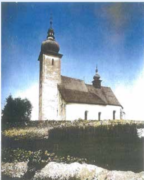
Rímskokatolícky kostol v L. Jáne na kolorovanom zábere z prvej tretiny 20. storočia Liptovské múzeum v Ružomberku

Aby po tomto nariadení neostali ľudia bez soli, bolo liptovským soľným skladom zakázané soľ predávať kupcom. V júli bol zakázaný pravidelný jarmok v Liptovskom Trnenci a Sielnici. Po vypuknutí cholery v auguste 1831 sa nariaďovalo v postihnutých obciach zavrieť školy, kostoly a krčmy a zakázať jarmoky. Domy kde sa nachádzali chorí alebo mŕtvi mali byť uzavreté a strážené. Chorí ani zdraví ich nemohli opustiť. Mŕtve telá mali byť na miesto pochovania odvezené zvláštnym vozom a do hrobu mali byť spúšťané bez dotknutia štyrmi železnými hákmi. Mŕtve telá v hromadných hroboch mali byť zasýpané vápnom, pieskom a skalami. Takéto miesto malo byť potom obkopené priekopou. Veci z postihnutých domov mali byť všetky spálené a prísne bolo zakázané predávať obnosené šatstvo.